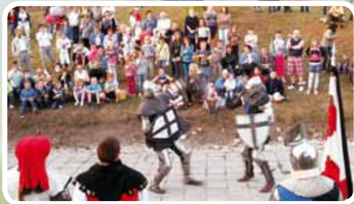
Majówka z LGD na Górze Zamkowej w Starogardzie